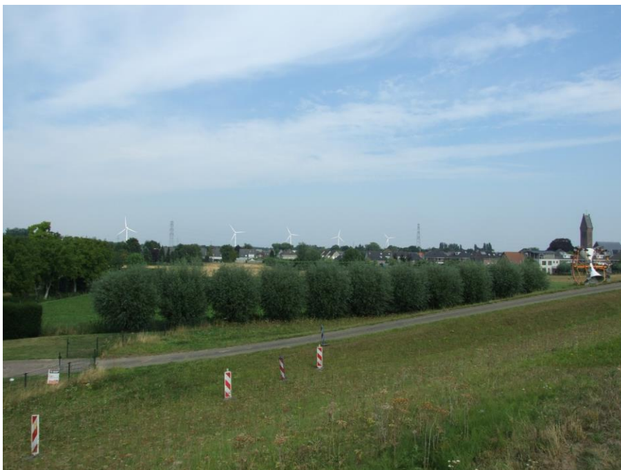
Zo zou het er uit kunnen zien (visualisatie Pim de Ridder)

Stap voor stap komt het windpark dichterbij. Het uiteindelijke ontwerp voor het windpark volgt uit een aantal studies, waarvan de Milieu Effect Rapportage (m.e.r.) een belangrijke is. Op 24 september heeft het College van B&W de notitie Reikwijdte en Detailniveau (zie hieronder) goedgekeurd; de formele start van de procedures om de benodigde vergunningen en toestemmingen te krijgen. Plan is om drie varianten te onderzoeken, waarvan de voorkeursvariant negen turbines betreft op grondgebied van de gemeente Nijmegen (5) en Overbetuwe (4). WindpowerNijmegen richt zich primair op de realisatie van de vijf turbines in het Nijmeegse deel. Maar door de nauwe verwevenheid van de twee delen van het project wordt de m.e.r. voor het gehele project uitgevoerd.