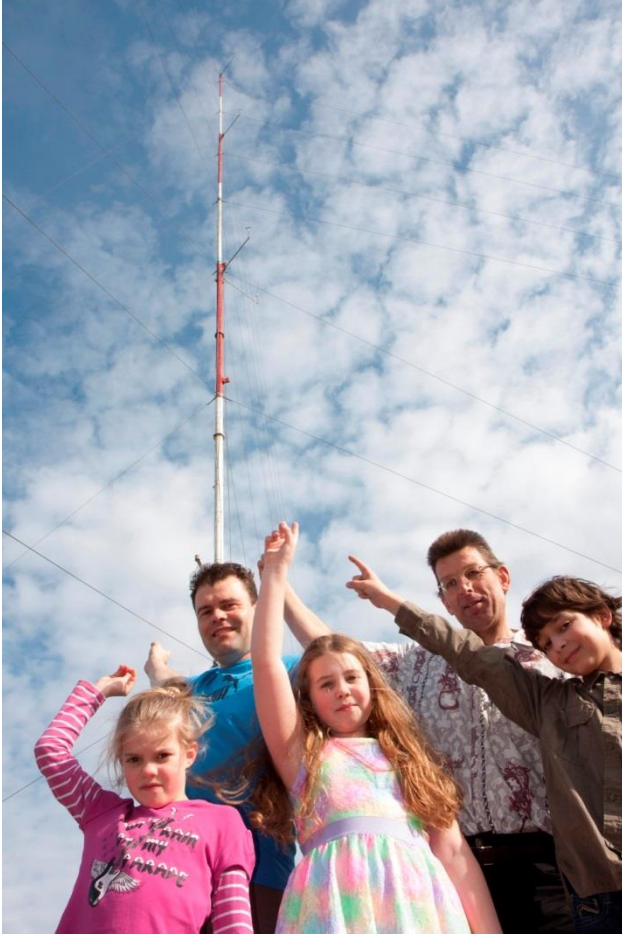
Bij de windmeetmast

Windpark Nijmegen contact@windparknijmegen.nl